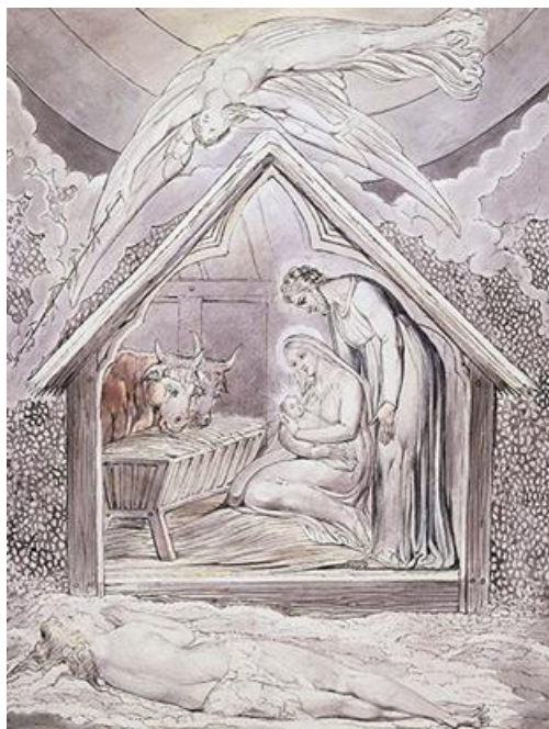
(*) Pintura: On the Morning of Christ's Nativity - 1803-1817 - William Blake

A Filosofia Rosacruz é imensa e traz relatos de Grandes e Iluminados seres humanos, que nos ajudaram e nos ajudam neste imenso Campo de Evolução.