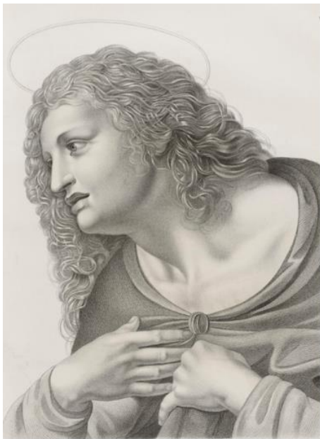
Last Supper - Head of St Philip (1490) – por Leonardo di ser Piero da Vinci