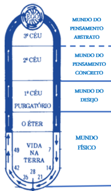
UM CICLO DE VIDA

Não como muitas pessoas pensam: morreu aqui, acabou. Ou, morreu aqui vamos para um Céu, ou um Purgatório ou, ainda, para um inferno. Ou, pior ainda, "não sei e vou deixar para pensar quando estiver próximo dela" (!?)